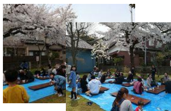
天明公園お花見 4月14日